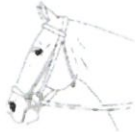
Düşük Burunsalık (Dropped Noseband)

Çapraz bir burunsalığın iki deri kayışının birleşim yerinde küçük bir koyun derisi disk kullanılabilir.