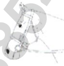
Normal Burunsalık (Cavesson Noseband)