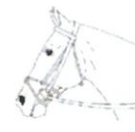
Çapraz Burunsalık (Crossed Noseband)